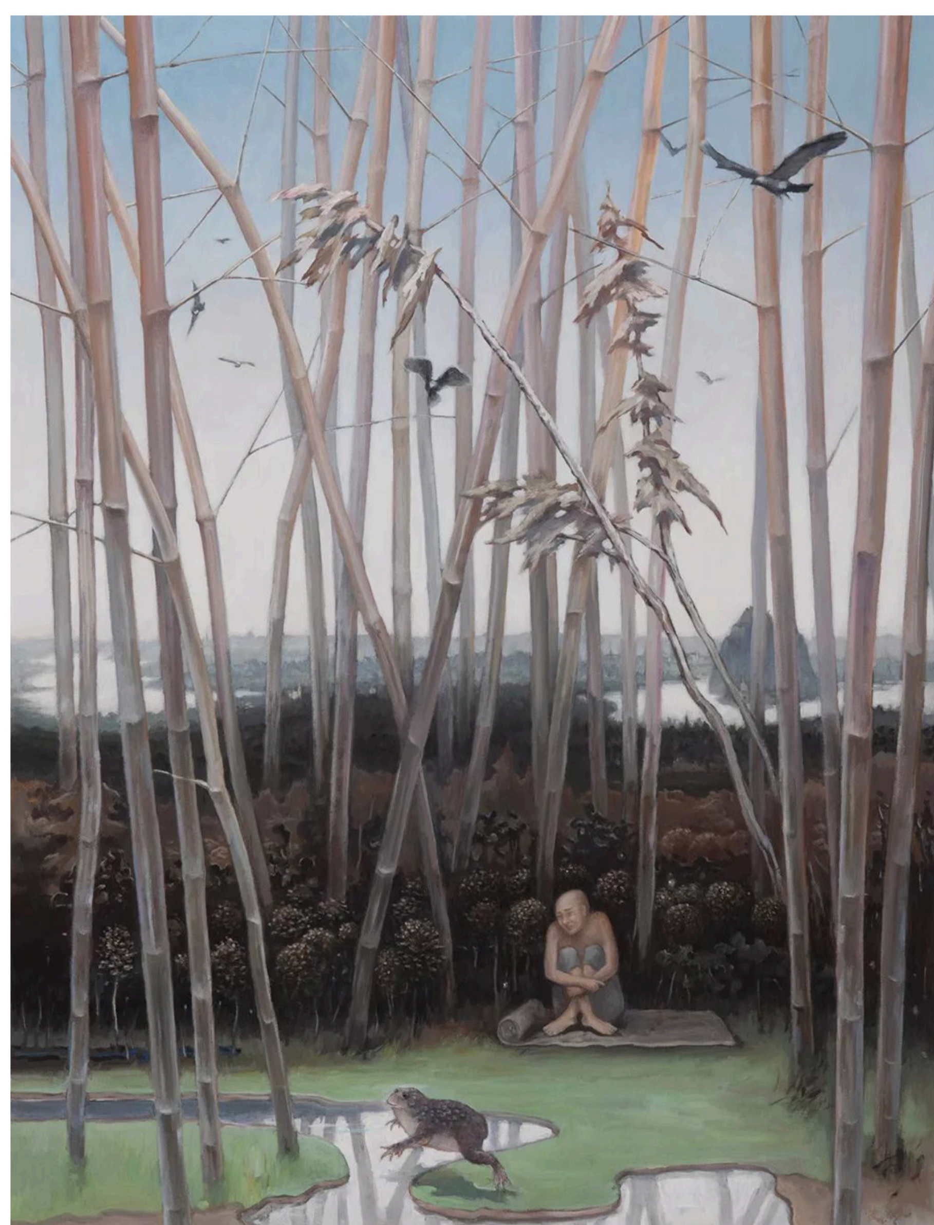
一水之隔 Passage, 布面油画, 130x97cm, 2019

茹小凡在近期的作品中诠释了通道的仪式。通过画家的视角, 开启了一个以碎片和隐喻的方式呈现生命的圣事。茹小凡感兴趣的是事物的象征性, 诗意形式的余晖感, 他以这种方式来进行艺术创作。